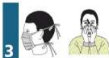
3er PASO: COLOCACIÓN EPP BARBIJO