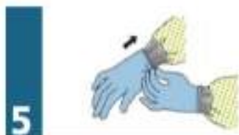
5to PASO: GANTES