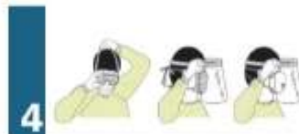
4to PASO: COLOCACIÓN GAFAS O MASCARA