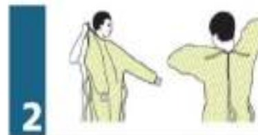
2do PASO: COLOCACIÓN DE CAMISOLÍN